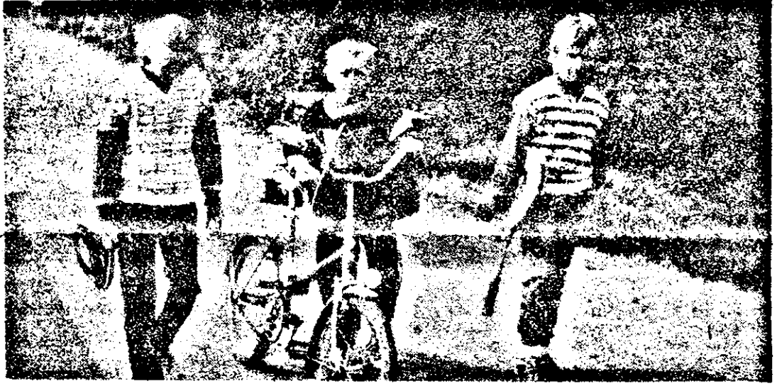
A fost greu antrenamentul.