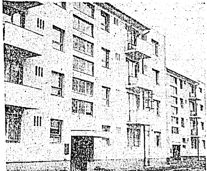
Blocuri noi date de curând în folosință la Chișineu Criș.