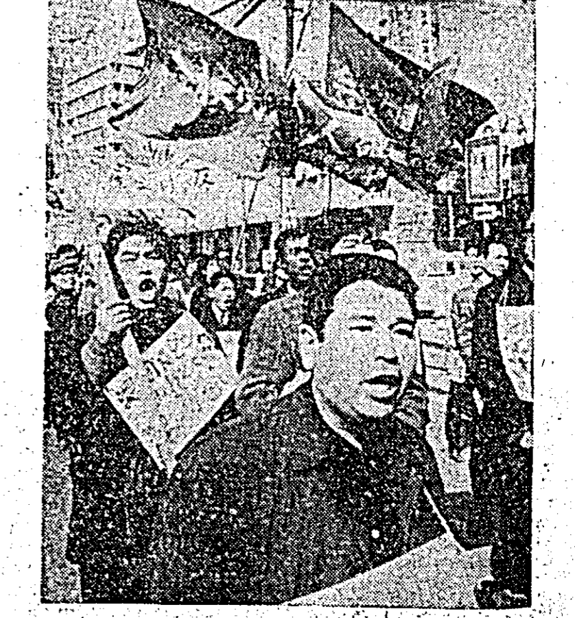
O acțiune largă revendicărilor a muncitorilor japonezi desfășurată recent pe tot cuprinsul insulelor nipone, cerîndu-se oprirea creșterii preturilor și mărirea salariilor. De pildă, la Tokio, 210.000 muncitori cu familiile lor au demonstrat pe străzile capitalei protestînd față de neîncredința ridicare a costului vieții. ÎN FOTOGRAFIE: Aspect de la demonstrația muncitorilor din Tokio.