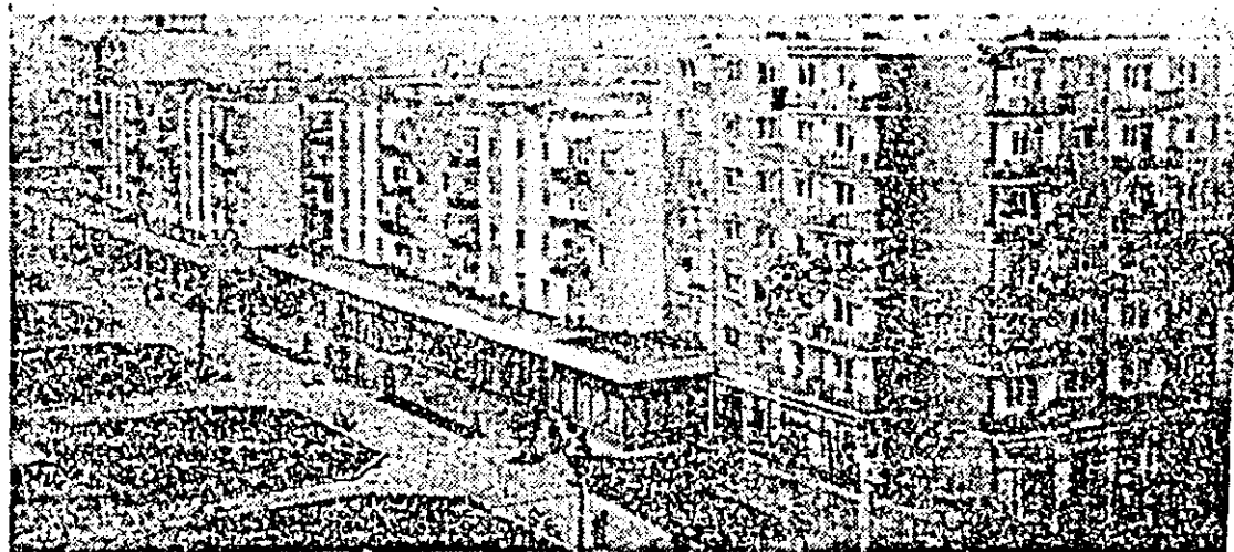
Cartierul Micăleca din Arad a cunoscut în ultimii ani o puternică dezvoltare.

Adresându-se celor aflați aici, secretarul general al partidului, președintele Republicii, tovarășul Nicolae Ceaușescu, a spus: