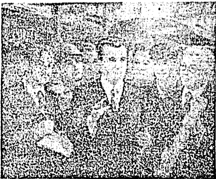
„Un om între oameni” — pictură în ulei de Fr. Toth.