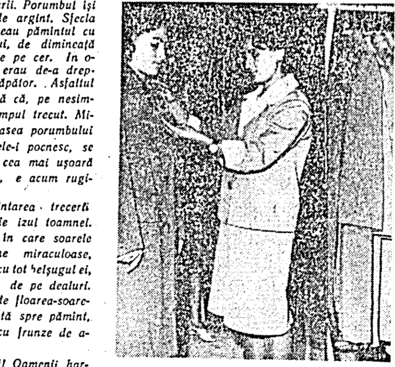
Vinzătoarea Dolna Pava de la magazinul „Universal” e bucurată că poate oferi cumpărătorilor un bogat sortiment de confecții pentru sezon.