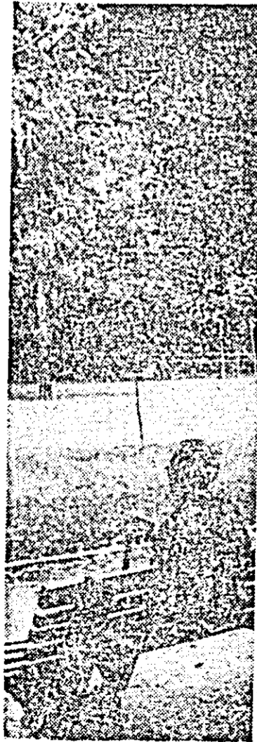
Căderea frunzelor e un semn al toamnei, dar și un îndemn la meditație...