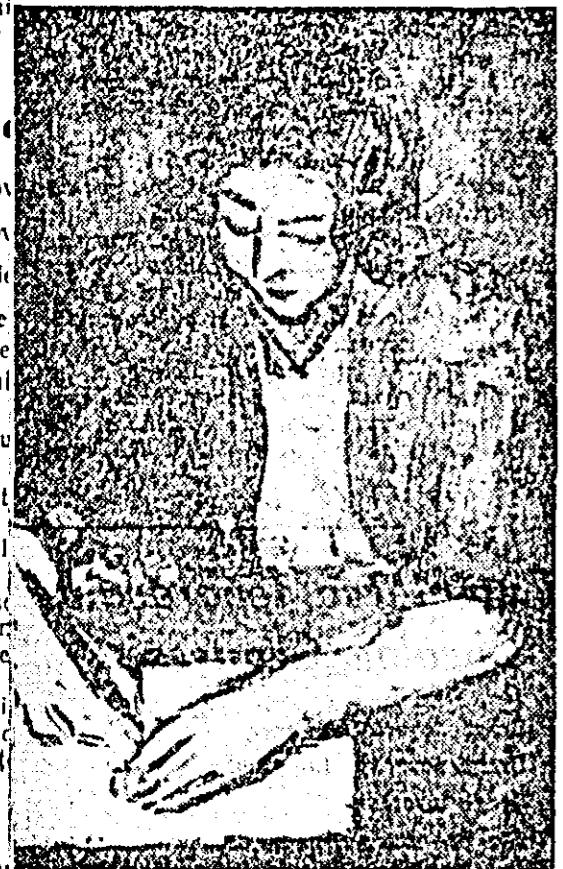
Al. Ciucurencu: „Portret de femeie”.