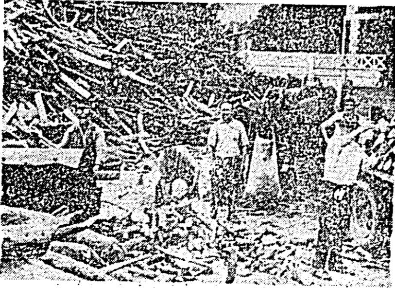
După cum vedeți, la depozitul de lemne nr. 13 e destulă... dezordine.