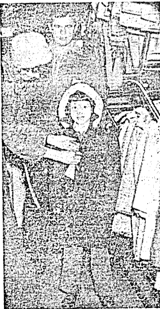
Raionul confecției pentru copil al complexului comercial Lipova este foarte solicitat în aceste zile.