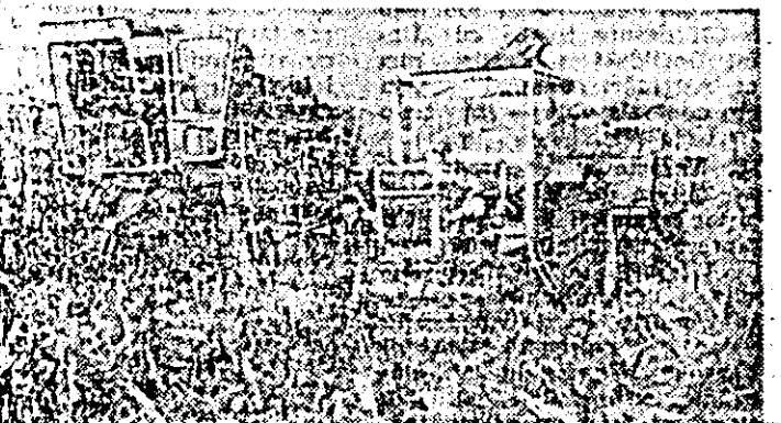
La ferma nr. 4 a I.A.S. Nădlac se lucrează intens la recoltatul porumbului.

Mecanizatorii din I.A.S. și membrii cooperativelor agricole de producție, au sărbătorit „Ziua recoltei” cu succes în bătălia pentru înfrîngerea semănăturii și strîngerea mecanică a recoltei de porumb și de zahăr. Pe ogoarele unităților agricole cooperatiste au fost postate 18 000 mecanizatori cooperatori printr-o altă lucrărilor porumbului de pe 1 200 hectare sîclet de zahăr de pe 150 hectare — din care au transportat peste 3000 tone — și însoțit 1 500 tone de diferite nutrienți. Și pe ogoarele I.A.S. un număr de mijloace mecanice sunt umare au participat la recoltarea și transportul porumbului la însoțări și alte lucrări sezoniere.