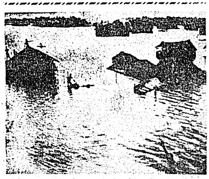
INDIA. Inundațiile care s-au produs în suburbiile Calcuttei, ca urmare a ploilor torrențiale care au căzut 6 zile continuu asupra regiunii, au provocat moartea a peste 20 de persoane.

AMMAN 15 (Agerpres). — Un purtător de cuvînt al Frontului Popular pentru Eliberarea Palestinei (FPEP) a precizat marți la Amman, în cursul unei conferințe de presă, condițiile — sensibil modificate — puse pentru eliberarea celor 54 de pasageri reținuți ca ostatici. Acestea includ pe lângă eliberarea palestinienilor deținuți în Elveția, RFG și Anglia și publicarea unei declarații de principiu prin care Israelul să se oblighe să elibereze pe cei doi cetățeni algerieni reținuți luna trecută la Tel Aviv, pe un tânăr elvețian aflat în închisoarea din Haifa sub acuzația de a fi colaborat cu FPEP, precum și pe cei 10 soldați libanezi făcuți prizonieri în luna Ianuarie de unități israeliene. În timpul unei incursiuni pe teritoriul Libanului. Prin această declarație Israelul ar trebui, de asemenea, să se angajeze că va pune în libertate un număr neprecizat de prizonieri palestinieni, pe baza unor liste ce vor fi prezentate ulterior de FPEP, în schimbul eliberării ostaticilor israelieni, americani și ai celor cu dublă cetățenie.