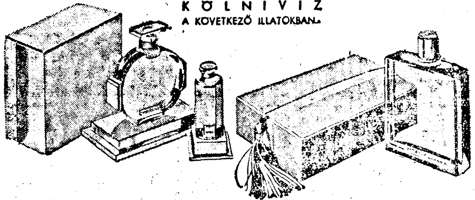
GEMEY * LE DEBUT VERT LE DEBUT NOIR * RICHESSE