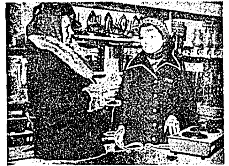
În mod aprovisionat, asigurînd o servitire optimă cumpărătorilor, magazinul nr. 113 — electric al I.C.S.M.I. Arad cunoaște zilnic o mare afliuență de solicitanți.

Circumscripția financiară a municipiului anunță proprietarii particulari de mijloace de transport (autoturisme, motociclete, motoare, bărci cu și fără motor) că sînt obligați să achite impozitul și prima de asigurare integral pînă la 31 martie a.c. După expirarea termenului se calculează majorări.