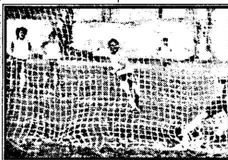
Golul cu numărul 2 al Gloriei, înscris de Petic din penalty.