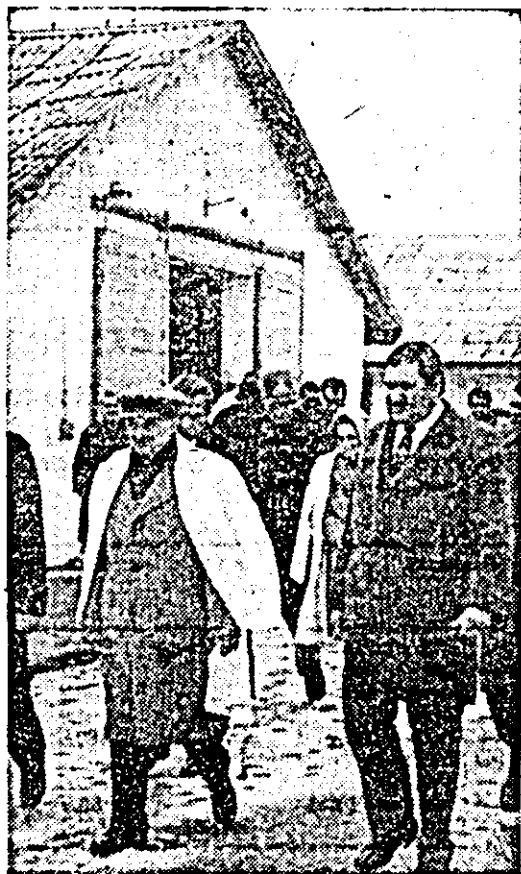
Tovarășul Nicolae Ceaușescu în vizită la I.A.S. Peșca.

Văzînd în prezentul țării modelul ideal al comunistului, eu și tovarășii mei de muncă sintem cu gîndul și fapta alături de Omul pe care țara îl sărbătorește.