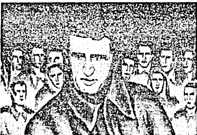
„La milling”, tapiserie de Elena Stoicescu-Muntean.

Ceaușescu la îmbogățirea gîndirii social-politice revoluționare și rolul său determinant la elaborarea și împlinirea politicii interne a partidului și statului nostru”.