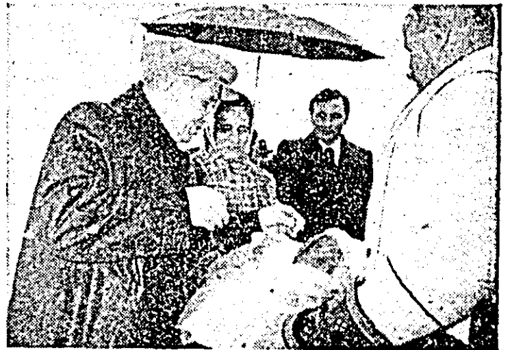
Tovarășul Nicolae Ceaușescu și tovarășa Elena Ceaușescu sînt întâmpinați de locuitorii județului Arad cu cele mai alese sentimente de stimă și respect.