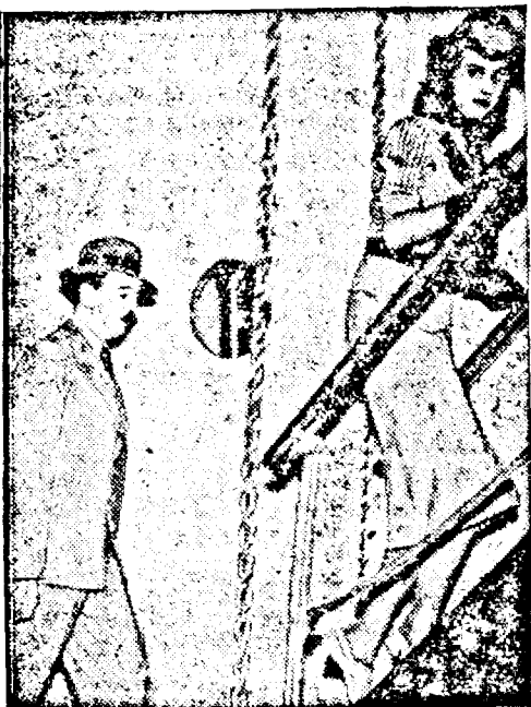
După ce a părăsit Bucureștiul, ex-regele Zogu al Albaniei se urcă, urmând regina Geraldina pe bordul vasului cu care călătorește în căutarea unui domiciliu definitiv.