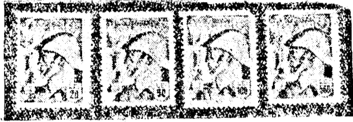
Timbrele pentru ajutorarea familiilor ostașilor

Gruparea Politehnica vine la Arad încenjurată de frumoase succese, iar matchul amical care se va disputa în compania Crișane- i CFR, promite să fie un spec- tacol demn de văzut și la care desigur că publicul sportiv din localitate va asista în număr cât mai mare