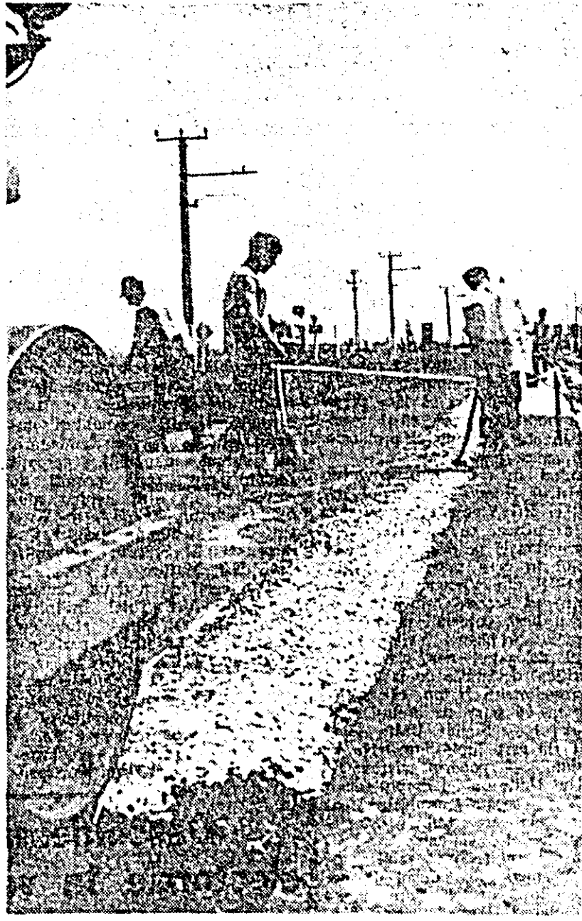
Lucrări de modernizare a șoselei Arad—Deva.

— În aceste zile — ne informăm: Gheorghe Holzer, președintele consiliului popular comunal Păuliș — vrem să dăm în folosință cetățenilor brutăria, macelăria, un nou magazin pentru pîine și lapte, o librărie (asta la