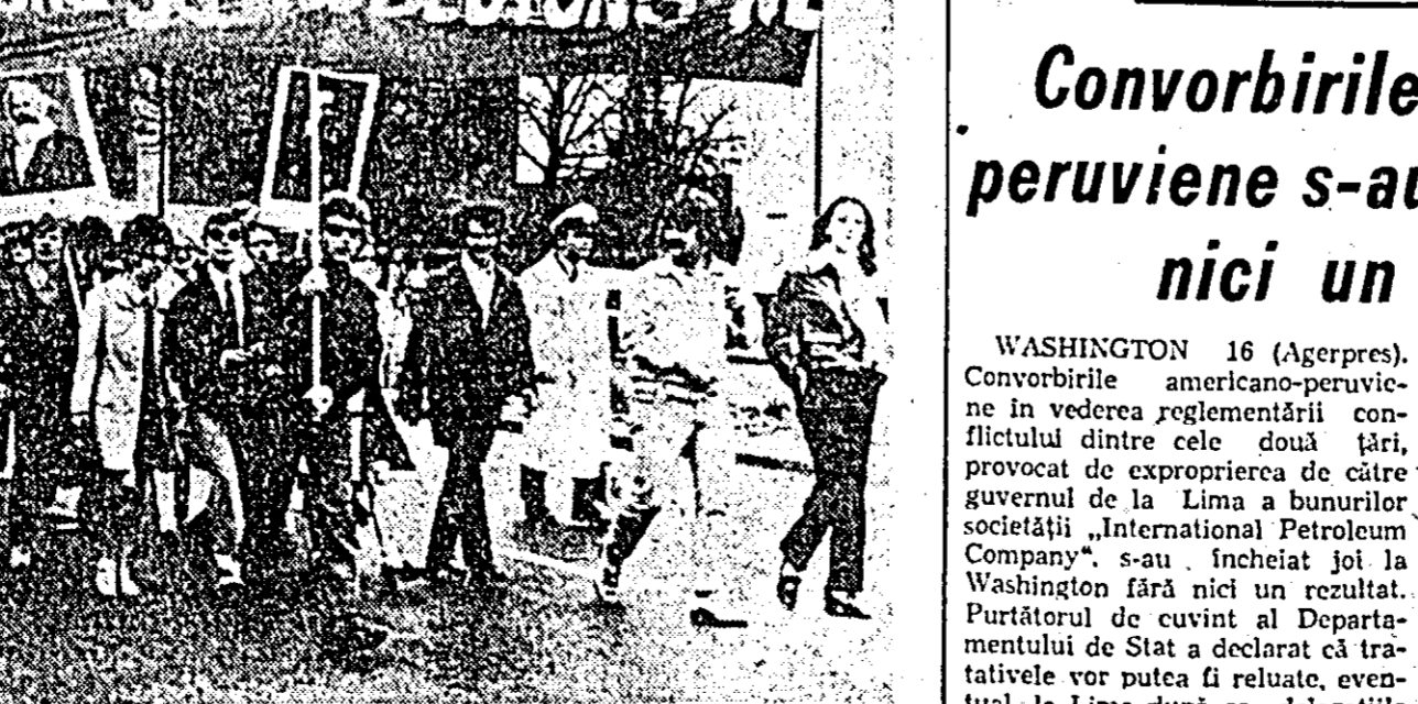
BERLINUL OCCIDENTAL. — Mai multe sute de ucenici din industria automobilelor și tineri muncitori din alte ramuri industriale au participat la o demonstrație în Berlinul de vest. Ei au protestat împotriva metodelor de exploatare folosite în fabrici care afectează în mod special cadrele tinere, care sînt lipsite de ajutor profesional și social. ÎN FOTO: Aspect de la demonstrație.

AGENZIA ACTC, CITIND INFORMAȚII provenite de la Seul, anunță că poliția sud-coreeană a arestat 16 persoane-sub acuzația de „activitate antistatală”. Intrucât arestările s-au efectuat în baza „legii privind anticomunismul”, cele 16 persoane, printre care se află și un membru al Adunării Naționale sud-coreene, sînt pasibile de pedeapsa cu moartea. Regimul sud-coreean a anunțat că alte 40 de persoane urmează să fie arestate.