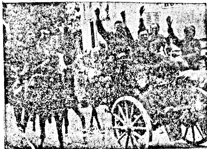
Marșul victorios al trupelor germane în Franța