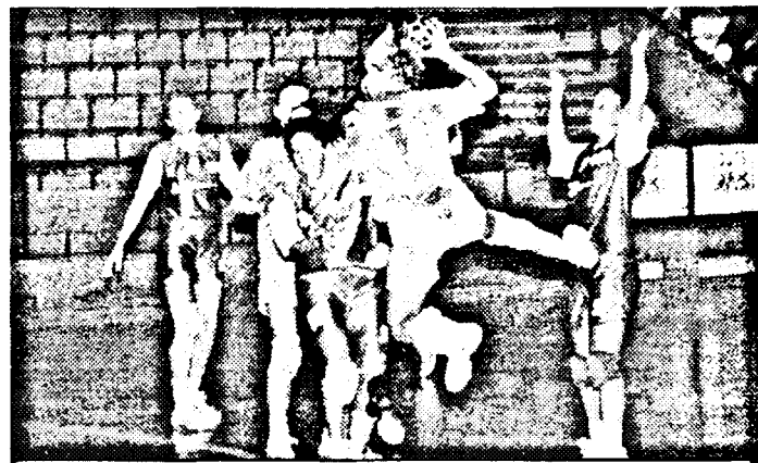
Arădencele, la prima victorie după îndelungate căutări. Fază din meciul Sabina U.V.V.G. Arad - Viitorul Mediaș