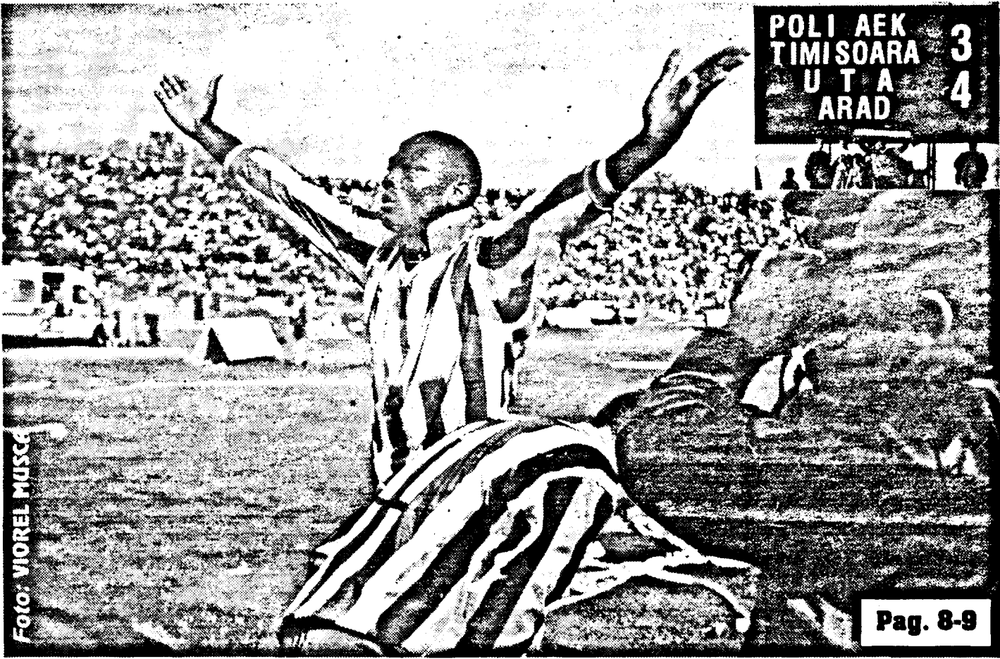
Camerunezul Njok îmbrățișează tribuna arădeană după victoria cu 4-3 a UTA-ei în fața lui Poli AEK, la Timișoara