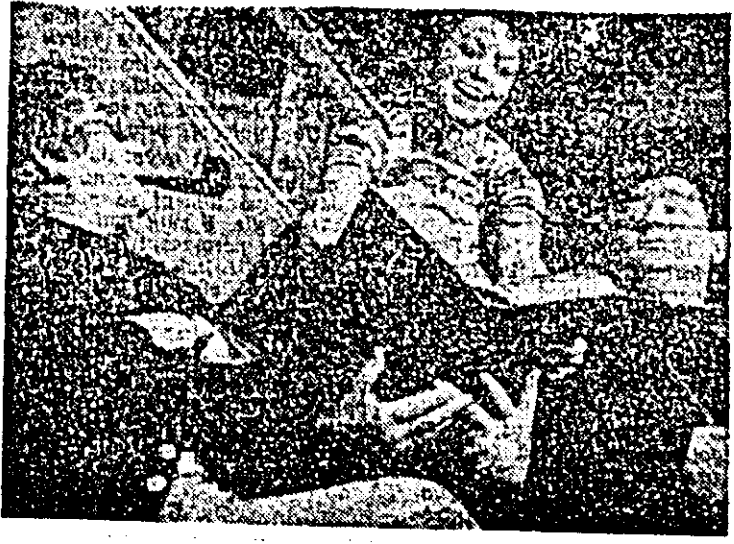
Moment din spectacol.