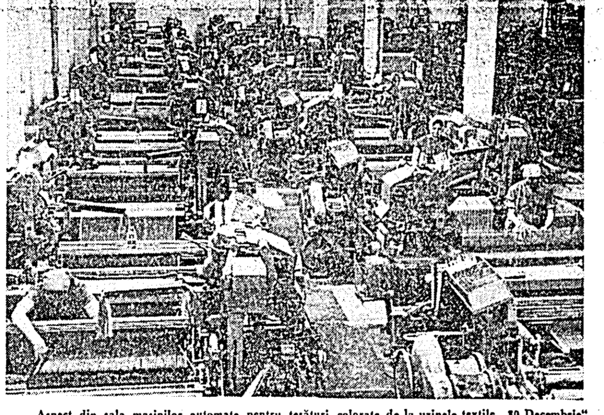
Aspect din sala mașinilor automate pentru țesături colorate de la uzinele textile „30 Decembrie”.

În toate uzinele și întreprinderile din orașul nostru se desfășoară o amplă acțiune de organizare științifică a producției și a muncii. Zilele trecute Comitetul orășenesc de partid a organizat o consfățuire la care au participat conducerea tehnico-administrativă și secretarii ai organizațiilor de partid din întreprinderi, cu scopul de a analiza stadiul în care se află desfășurarea acestei acțiuni, de a se generaliza experiența bună acumulată de unele întreprinderi. Concluzia care se desprinde din aceste discuții este că în majoritatea întreprinderilor, cu ajutorul organelor și organizațiilor de partid, esența acțiunii a fost înțeleasă și în consecință au fost create condițiile necesare pentru buna ei desfășurare. Comisiile și subcomisiile constituite în acest scop și-au orientat activitatea (ținând seama de specificul fiecărei întreprinderi) având în vedere cele mai importante probleme cum ar fi: organizarea conducerii și coordonării activității în întreprinderi, organizarea pe baze științifice a procesului de producție și a muncii, îmbunătățirea activității de normare și creșterea pe această bază a rolului normelor de muncă în organizarea producției și a muncii. Demn de subliniat este faptul că activitatea subcomisiilor a fost orientată just nu numai înspre stu-