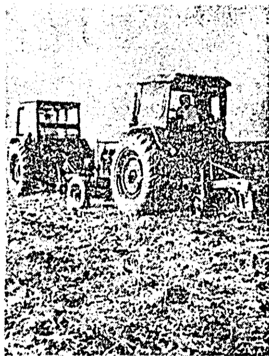
În consiliul agroindustrial Ghiroac mecanizatorii grăbesc ritmul arăturilor.

Acestea sînt cuvintele de ordine pe care le-am auzit în aceste zile în mai multe unități din cadrul consiliului unic agroindustrial Criș. Într-adevăr, și în această zonă, unde pămîntul nu este prea darnic, arăturile de toamnă executate în timpul optim constituie unul din factorii hotărîtori în obținerea unor recolte sporite. Tocmai în acest scop s-au luat măsuri eficiente ca după terminarea recoltării porumbului, principalele forțe să fie îndreptate spre efectuarea arăturilor. — Pentru grăbind arăturilor și ținînd cont de faptul că datorită