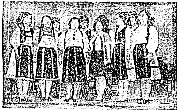
Brigada artistică a căminului cultural din Dezna pe scena festivalului.