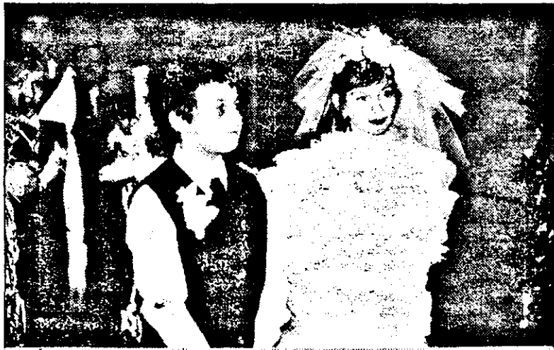
La serbarea organizată la Școala Generală „Nadăș” au fost desemnați „mirii” anului 1997. El, elev în clasă a IV-a, ea, colegă de clasă.

tuției, a declarat, miercuri, președinta Comisiei pentru Integrare Europeană, Mariana Stoica, cu ocazia lansării unei campanii de pregătire a consumatorilor din România la nivelul Uniunii Europene.