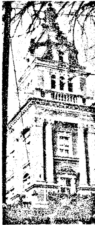
Arhitectură arădeană.