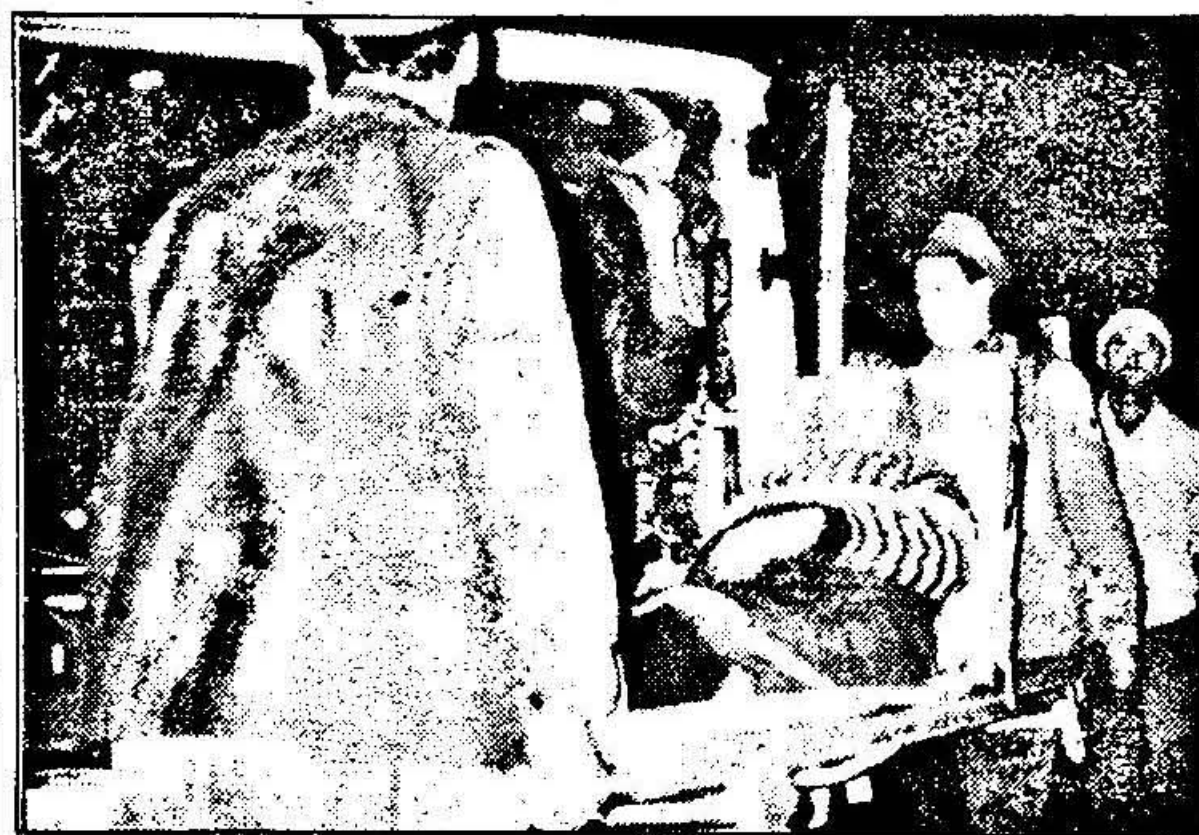
În stare de inconștiență fiind, pacientul trebuie transportat cu targa până la ambulanță.

Așteptarea n-a fost de lungă durată. Sunetul telefonului ne-a făcut să tresărim. D-l doctor Jipa răspunde apelului și în momentul imediat următor începe să noteze: un accident vascular cerebral. O femeie bătrână și singură care locuiește în Micălaca și-a pierdut cunoștința. După ce închide telefonul, d-l doctor apasă pe butonul unei sonerii. De trei ori. La câteva fracțiuni de secundă de la stingerea ultimului sunet, pe culoar se aud pași precipitați. În curte se aude zgomotul produs de pornirea unui motor, iar noi abia reușim să ne ținem de d-l doctor și asistentul lui. Abia urcăm în ambulanță, că aceasta se și pune în mișcare, iar în următoarea clipă ne trezim în