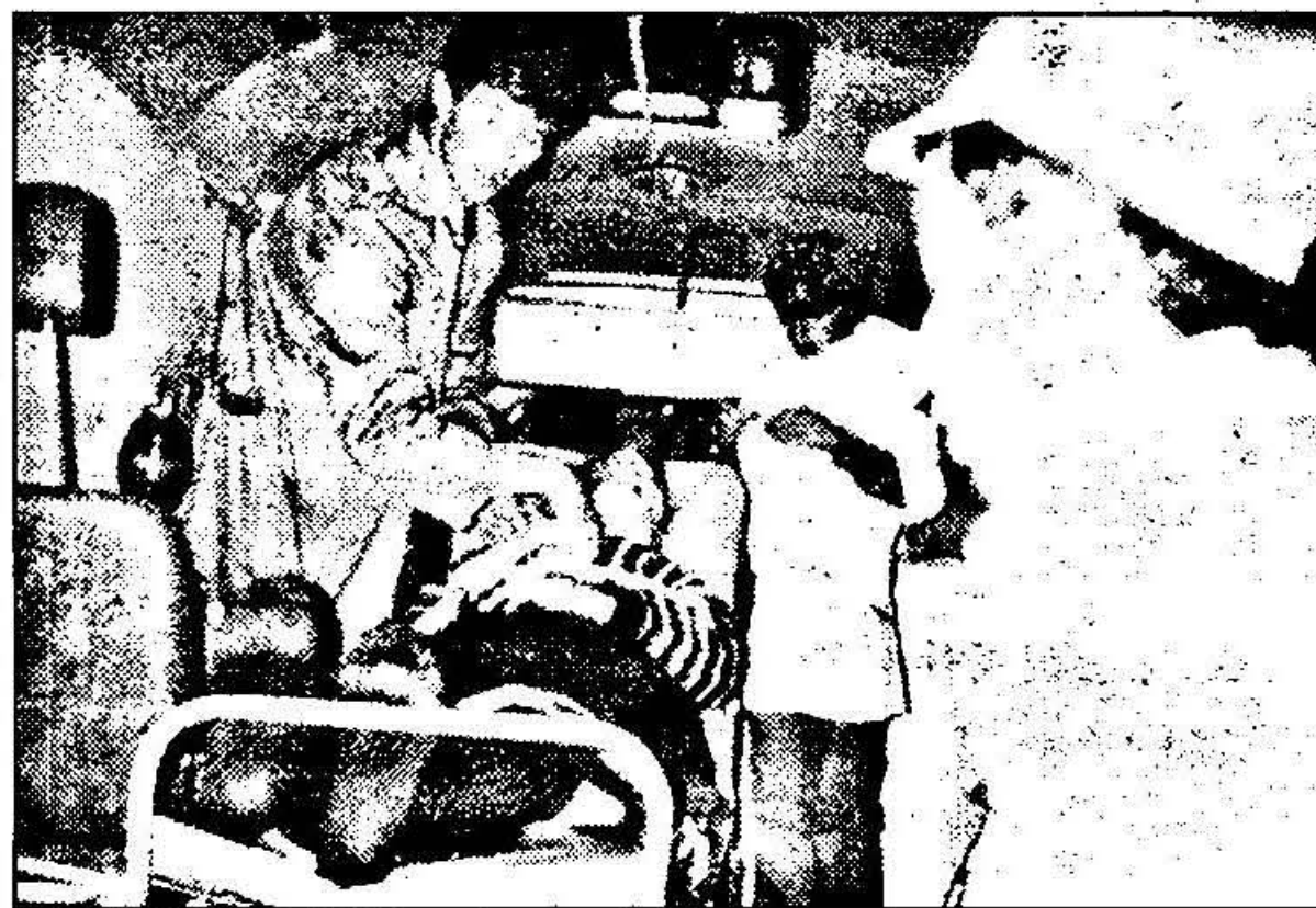
Primul ajutor continuă mai eficient în ambulanța dotată cu aparatură medicală de ultimă oră.