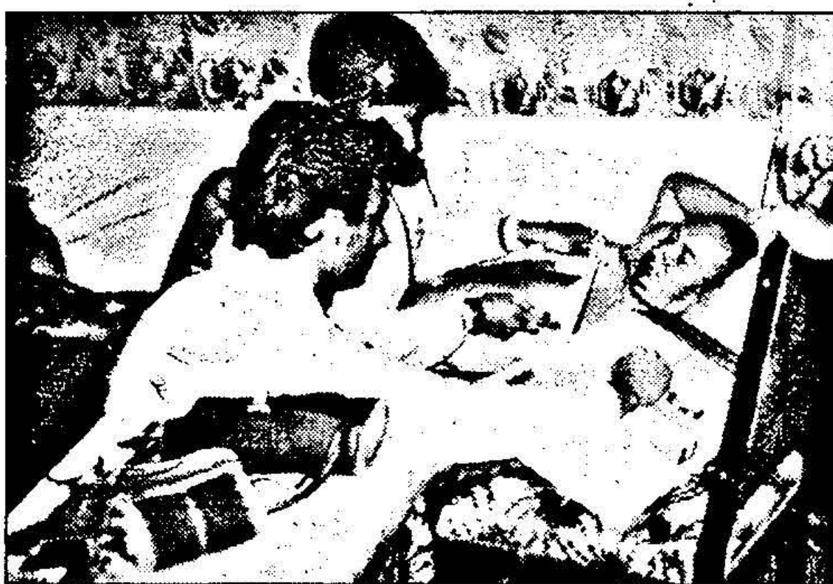
La nici cinci minute de la apelul telefonic, echipa SIAMUD acordă primul ajutor bolnavului.