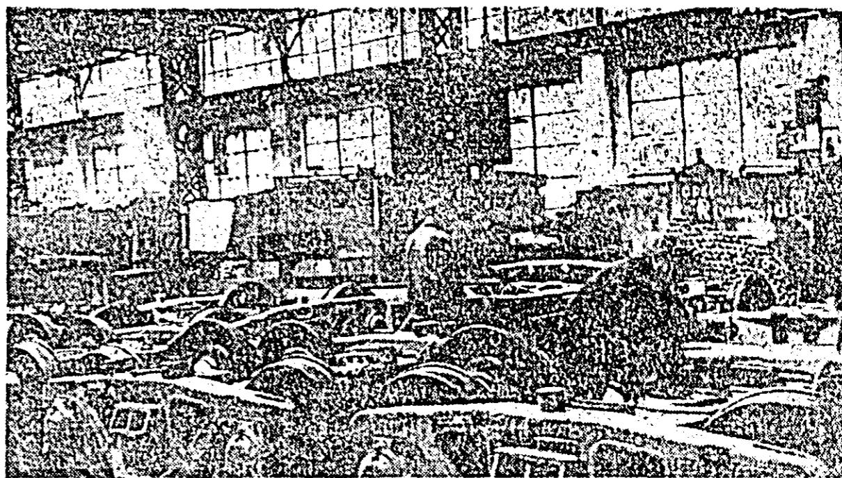
Aspect de muncă din secția boghlori a Uzinelor de vagoane.

În încheierea dezbaterilor a luat cuvîntul tovarășul Nicolae Ceaușescu.