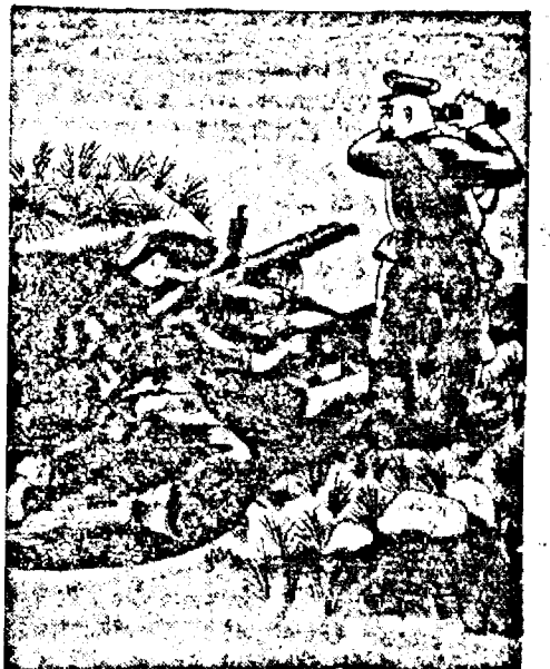
— „Foc! Vin spre noi deși!” — „Cine tovarășe comisar? Germanii?” — „Ce germani? Vin suldații noștri!”

est de Gambut avioane germane de tipul Stuka au atacat două crucișetoare inamice dintre care unul a fost lovit în mod grav.