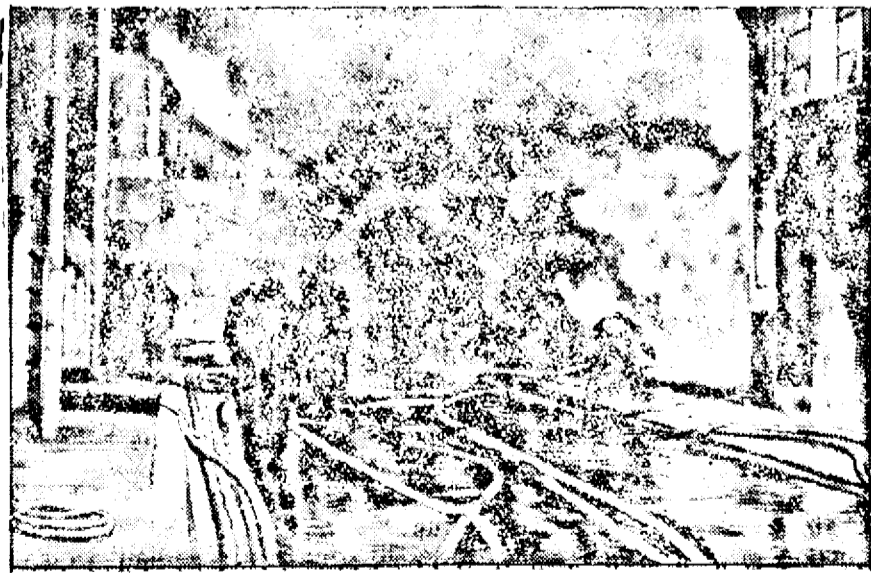
Clișeul nostru transmis prin fotografiere telegrafică, arată incendiul fabricii.

Pagubele sunt evaluate la 5 milioane coroane.