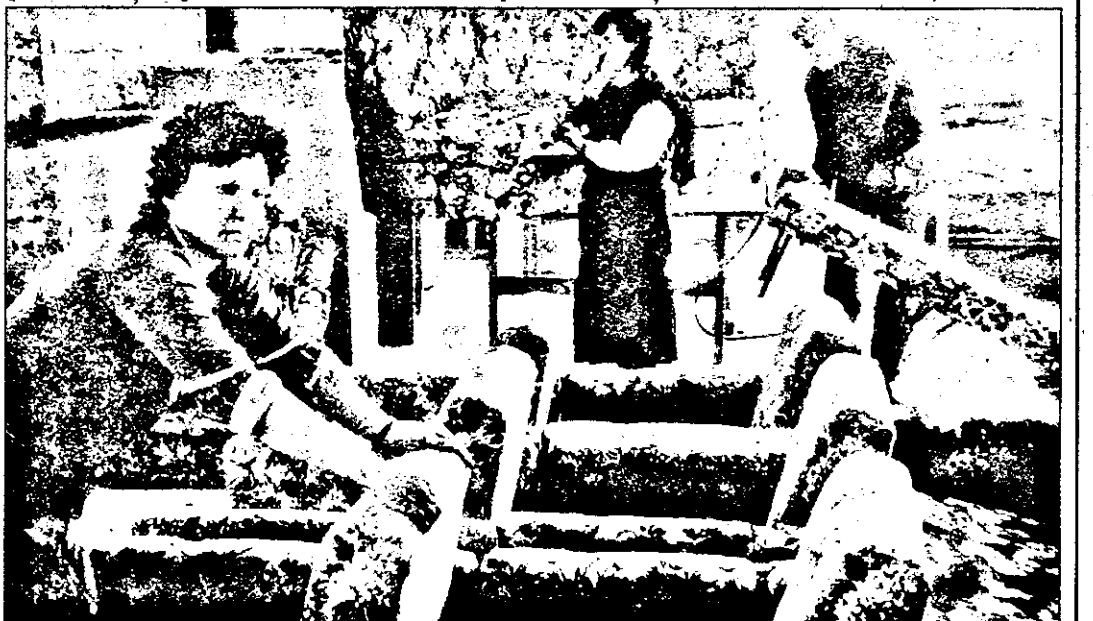
Revărsare de fanteze în compartimentul de tapițerie.