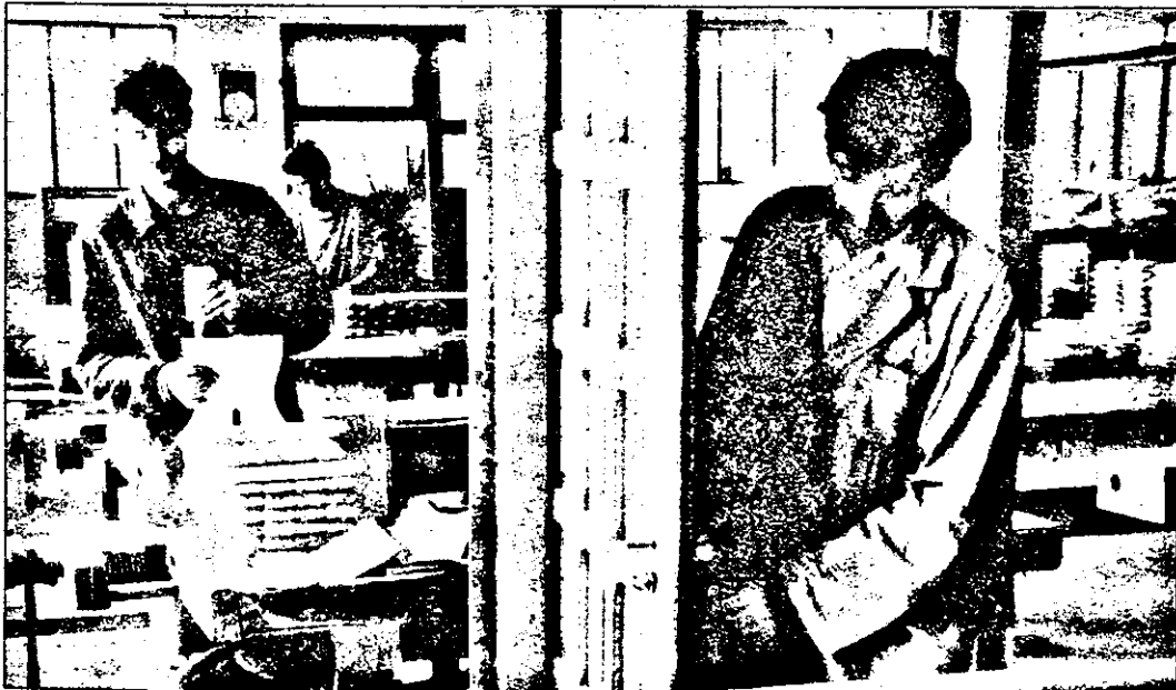
Operația de montare manuală a reperelor solicită întreaga pricepere a tinerilor muncitori.