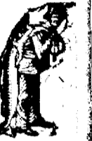
A Scott-féle Emulsió készítésénél és összetételénél kizárólag a legjobb nyersanyagokat használják.

nem talál jobb szert mint a közismert, méz- és nátron hipofoszfitek hozzáadásával készült Scott-féle Emulsió-t, melynek világhire 35 év óta különösen gyengésegnél és kimerültségnél mindinkább emelkedik. Ez azzal magyarázható, hogy a Scott-féle Emulsió készítésénél és összetételénél kizárólag a legjobb nyersanyagokat használják.