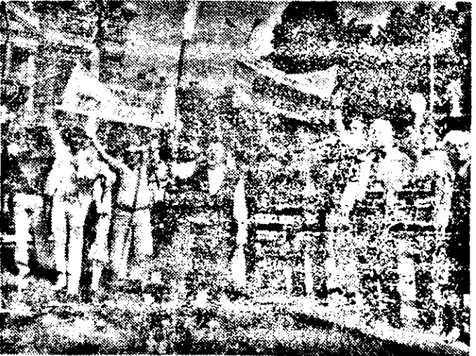
S-a optat pentru „huo!”

care l-a rugat să păstreze ordinea, spunându-le că F.S.N. e o organizație demnă și să nu uite apelul domnului Iliescu la calm, aceștia s-au retras de pe spațiul verde pînă la marginea bordurilor. După terminarea demonstrației, din partea Alianței a mai rămas un mic grup cu o portavoce, s-a scandat „Noi de-aceia nu plecăm, nu plecăm acasă, pînă nu vom cîștiga libertatea noastră!”, „Jos Iliescu!”, „Jos comunismul!”. Tot în final, domnul Voicilă, președintele C.P.U.N. al județului Arad care a vrut să vorbească la stație demonstrațiilor și contrademonstrațiilor, a fost refuzat de organizatorii demonstrației. Drept urmare, domnul Voicilă s-a adresat oamenilor de la stația din balconul primăriei, rugându-i să respecte reciproc convingerile și să se manifeste cu calm și înțelepciune. ... În seara aceeași „fierbinți” zite, în piața Primăriei arădene stăteau calm de vorbă câteva grupuri de oameni. Alături, în fața crucii și a listei cu numele martirilor arădeni ai Revoluției se odihneau buchete proaspete de flori și ardeau, tot calm, luminările.