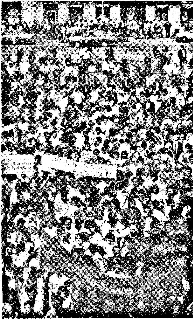
Demonstrația a fost pașnică.