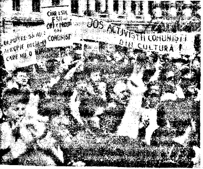
Semnul victoriei Revoluției din decembrie, atotputernic.