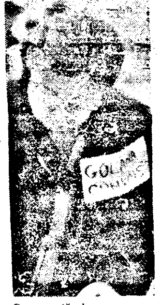
Cum arată de aproape o „golană convinsă”.

Anunț Recent, a luat ființă la Arad, Filiala județeană a Partidului Revoluției Române. Sediul său provizoriu: Calea Aurei Vlaicu, bloc A-9, sc. A, ap. 35, telefoane 46829 sau 22825.