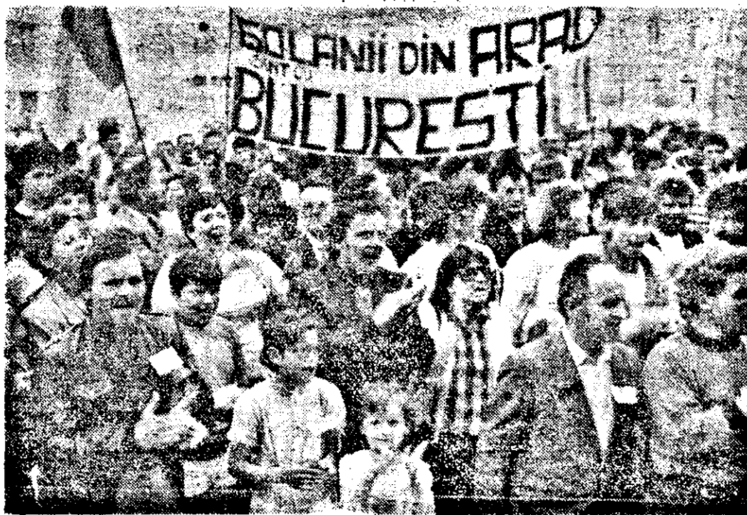
Tineri și virșnici, sub o „titlatură” pe care domnul Ilescu o regretă.