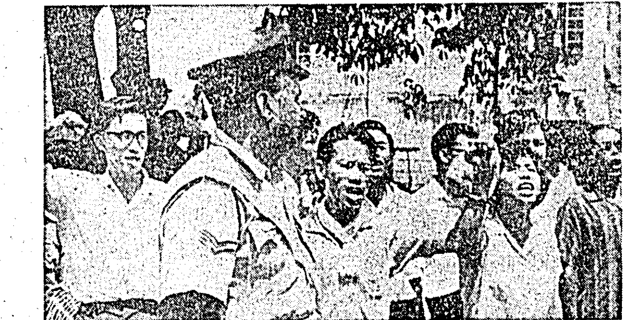
In Kuala Lumpur, capitala Malaeziei, au avut loc demonstrații antigovernamentale în semn de protest în legătură cu arestarea conducătorilor partidului socialist.

SAIGON 9 (Agerpres). În capitala sud-vietnameză a avut loc o reuniune a liderilor budiști care au examinat situația din țară. După cum relatează agenția UPI, ei au adoptat o declarație prin care cer guvernului SUA să-și retragă forțele armate din Vietnamul de sud, deși ei își însușesc punctul de vedere al autorităților de la Saigon în ce privește cauzele conflictului existent. Totodată, liderii budiști au chemat guvernul de la Saigon să se sprijinitorii acestui, SUA, să pună capăt atacurilor împotriva RD Vietnam. În declarație se cere, de asemenea, crearea unei „comisi de conciliere care să servească ca punte de legătură între autoritățile sud-vietnameze și guvernul RD Vietnam”.