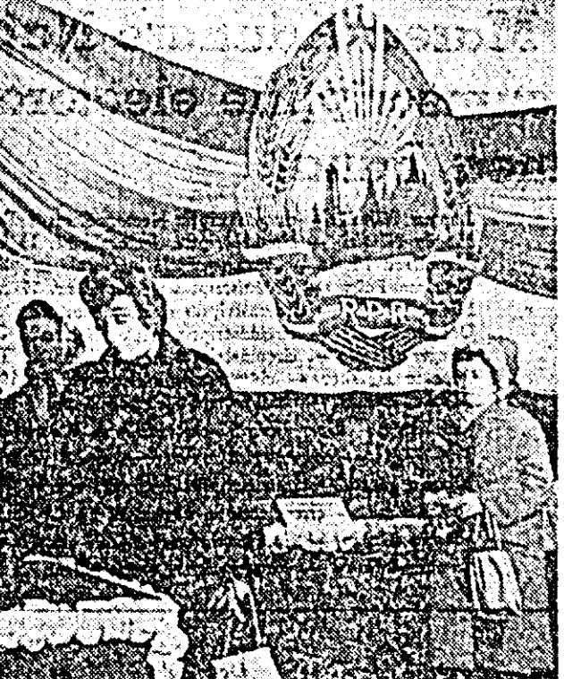
Aspect de la secția de votare nr. 11 din cartierul Pirneava.