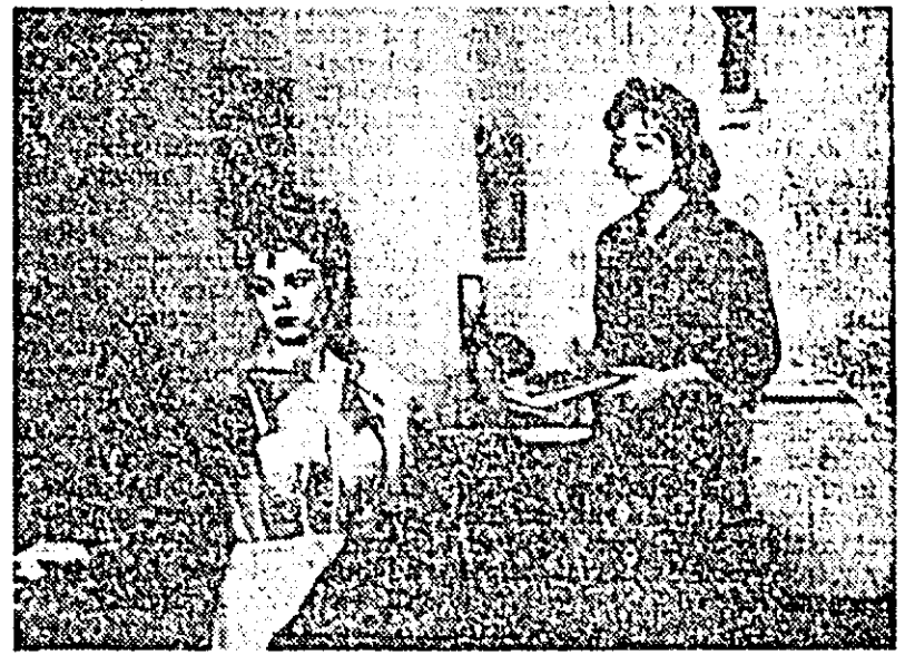
IN CLIȘEU: o secvență din film.