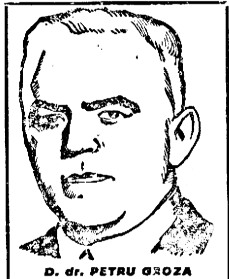
D. dr. PETRU GROZA

adevărate ale poporului. Trecutul de tristă și rușinoasă aducere aminte a regimurilor dictatoriale și