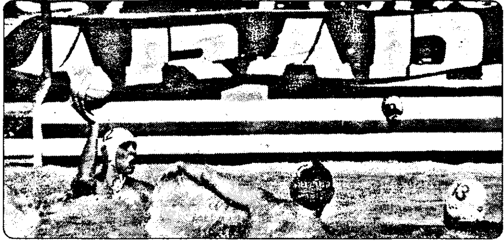
Terminând pe locul II, devenind vicecampion, s-a dovedit că „Aradul este fruncea”. Eșarfa de pe marginea bazinei demonstrează cert acest lucru.