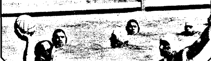
Spectatorii urmăresc, cu mare atenție, ce se întâmplă în derby-ul zilei. Fază din meciul Astra-Dinamo 5-10.