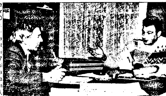
Reprezentanții celor două tabere care au transformat Primăria Vladimirescu într-un adevărat viespar.