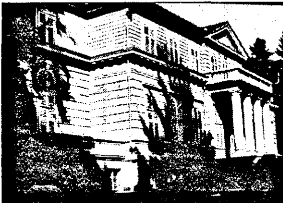
Castelul din comuna Săvârșin rămâne un principal punct de atracție pentru cei ce opresc la... „poarta de intrare” în județul Arad, de la Valea Muresului.