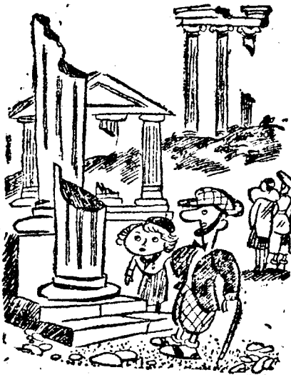
Érdekes! Nem is tudtam, hogy már a romlak idejében is voltak légitámadások.