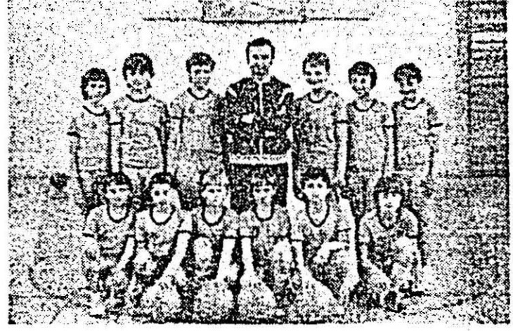
Echipa de minibaschet II fete a C.S.S. Arad — campioană a „Daciadei”.