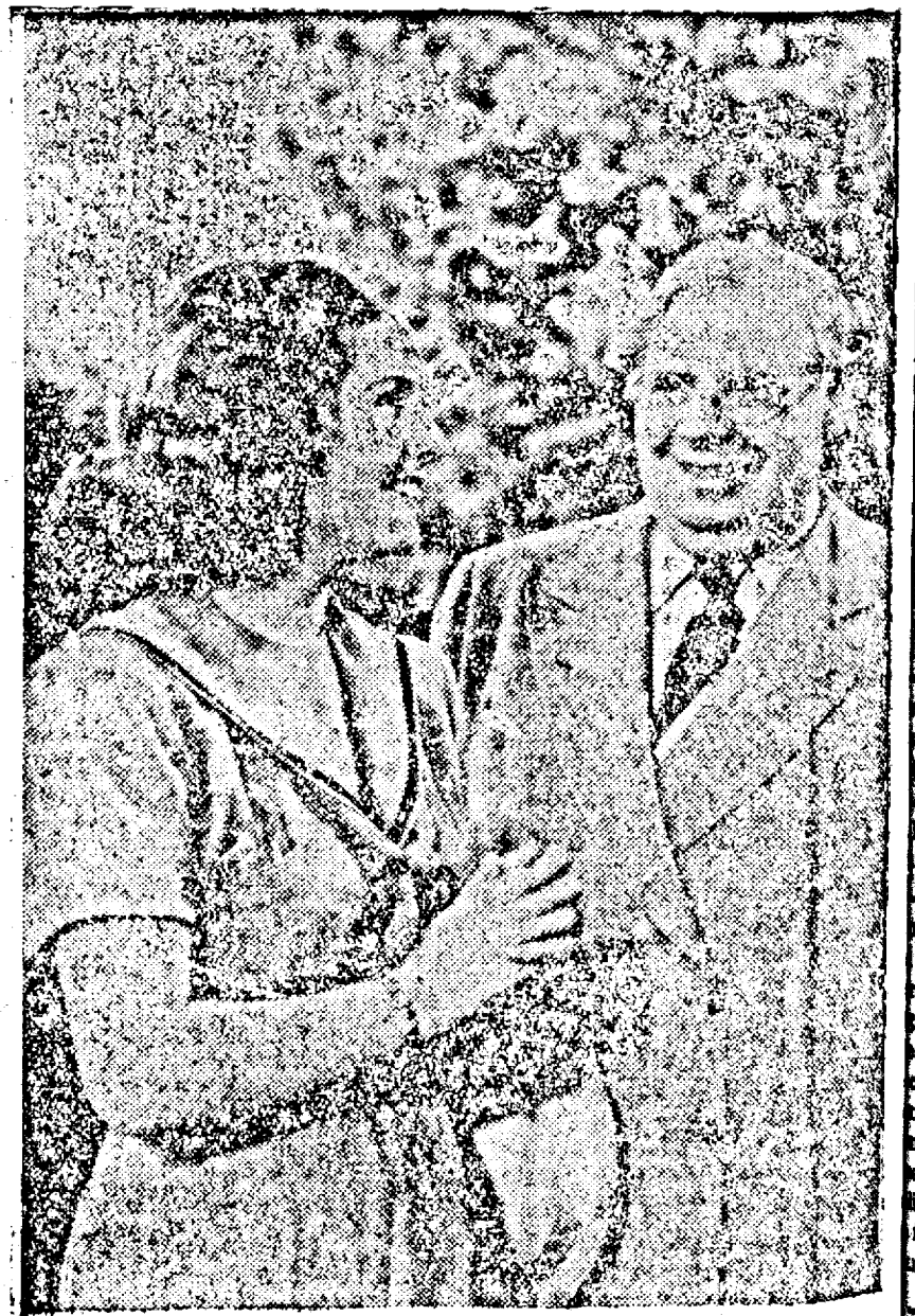
DEANNA DURBIN — SZÖKE SZAKALL