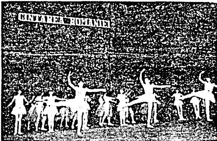
Dans tematic prezentat de elevii Școlii populare de artă.