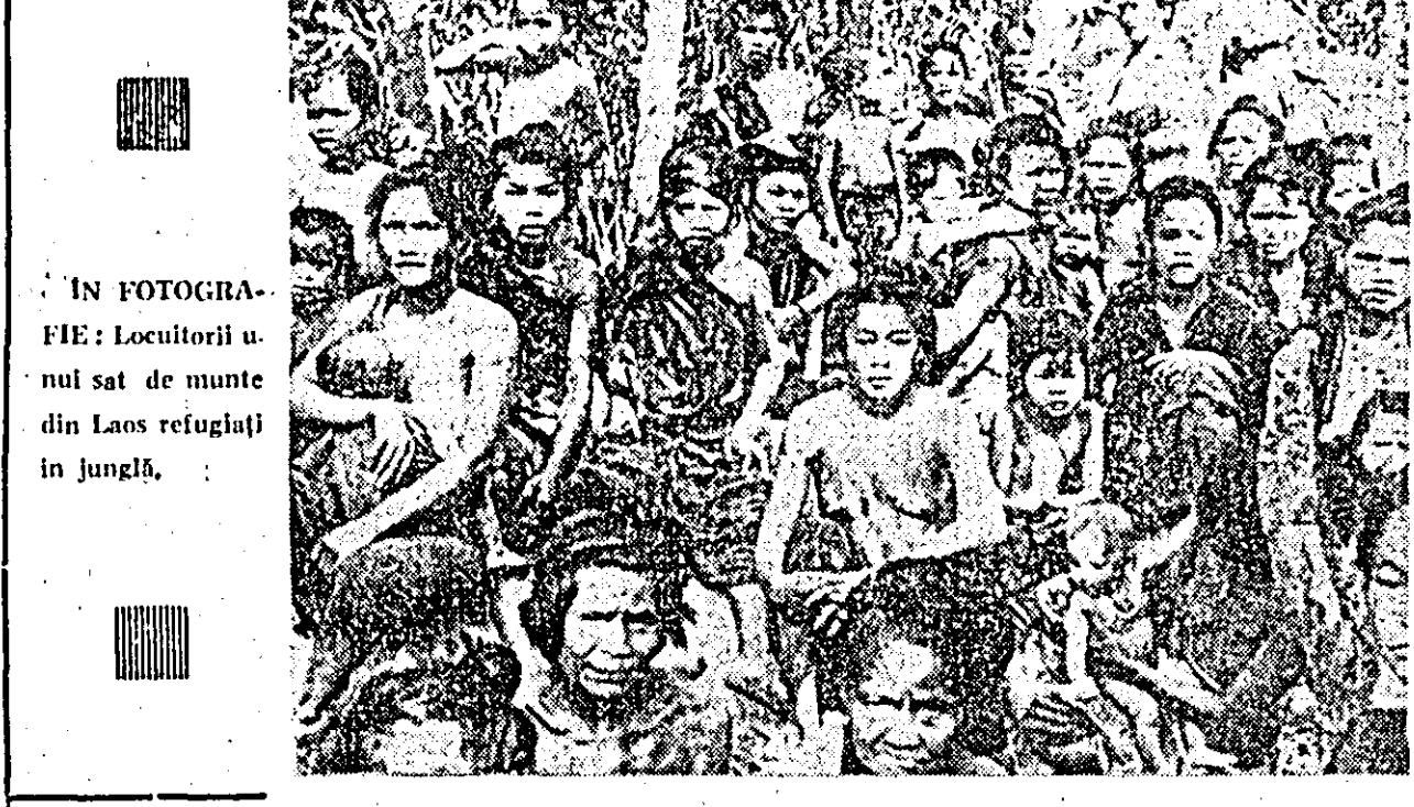
IN FOTOGRAFIE: Locuitorii unui sat de munte din Laos refugiați în junglă.

PEKIN 19 (Agerpres). — Agenția TASS anunță că luni s-au înnoptat la Pekin L. F. Iliev, adjunct al ministrului afacerilor externe al URSS, șeful delegației guvernamentale sovietice la convorbirile sovieto-chineze pentru reglementarea problemelor de frontieră.