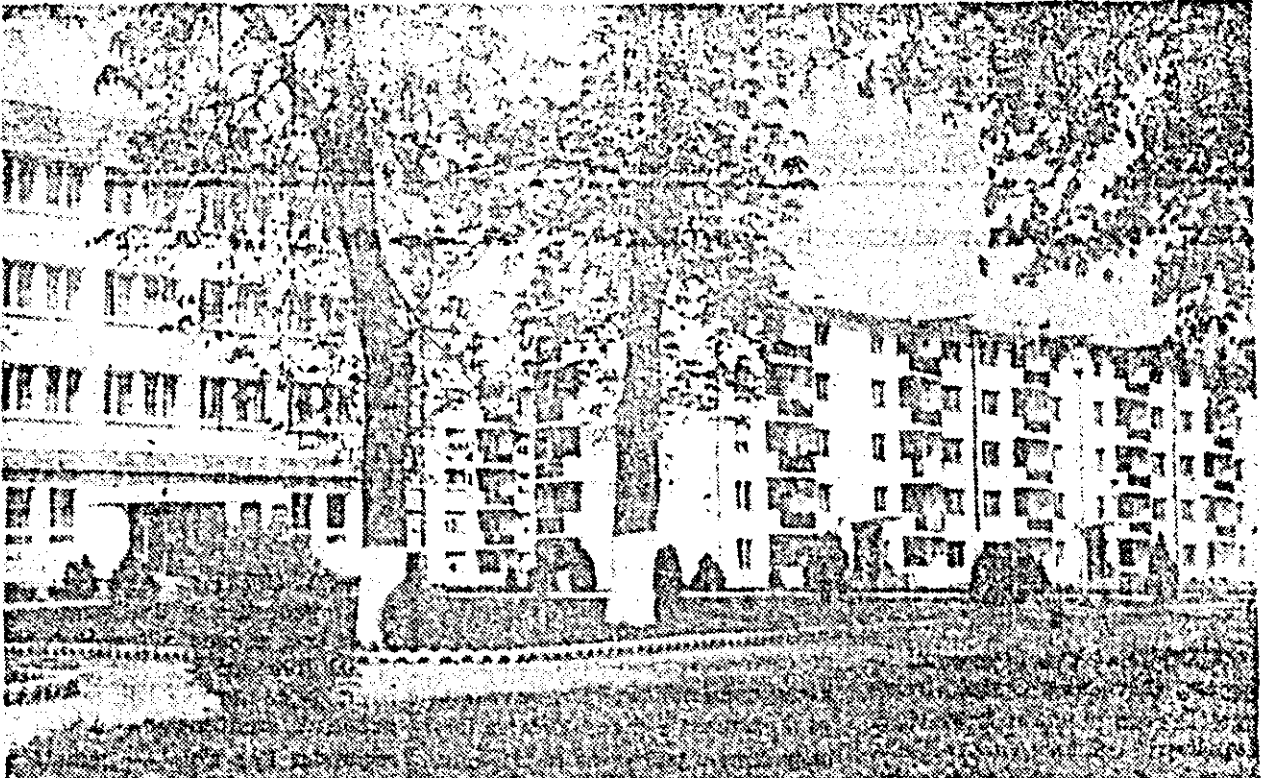
Construcții noi în orașul Ineu