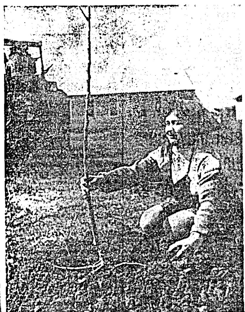
Încă unul...