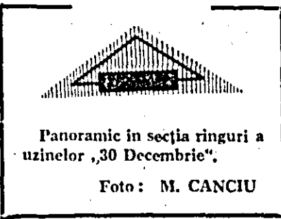
Panoramic în secția ringuri a uzinelor „30 Decembrie”.

2 Proportia dintre angajamentul anual de 300.000 m.p. țesături peste plan și numai 50.000 m.p. stabiliți pentru prima etapă ne-a îndemnat să cerem lămuriri în acest sens directorului combinatului. Din răspunsul primit am aflat câteva lucruri care fac cinste atît conducerii unității cit și țesătorilor de la fabrica Teba. Aici, începînd cu anul trecut, se pun eșalonat în funcțiune noi capacități de producție în final ajungîndu-se la o țesătorie modernă, de mare capacitate. La luarea angajamentului s-a mizat doar pe noile capacități incomplete, știindu-se că utilajele din țesătorie veche urmau să fie demontate în această perioadă. Dar, s-au găsit totuși posibilități de a se lucra paralel în țesătorie veche și cea nouă și astfel angajamentul a putut fi depășit cu peste 8.000 m.p. țesături, iar sarcina de plan cu aproape 60.000 m.p. În felul acesta finisajul a putut lucra ritmic, realizînd o calitate foarte bună, avînd asigurat stocul de manipulare necesar. O altă măsură organizatorică ce a concurat la realizarea și depășirea angajamentelor a fost materializarea ideii de a comasa cele două finisaje de la UTA și Teba și a le pune sub coordonarea unui singur inginer șef, specialist în probleme de finisaj, ing. Angela Ardeleanu. În felul acesta au putut fi uniformizate metodele de lucru optîndu-se în fiecare caz pentru cele mai eficiente, asigurînd concomitent aprovizionarea deopotrivă de bună a locurilor de muncă cu utilajele și materialele necesare.