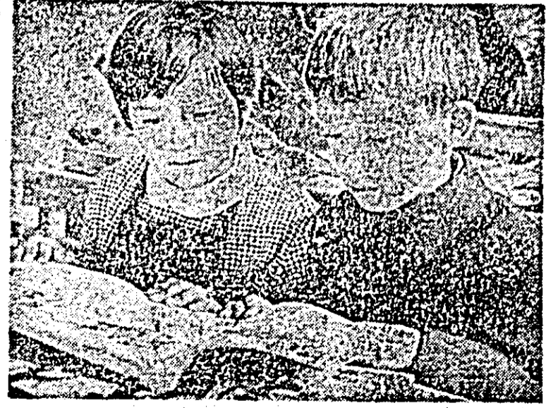
Prima întîlnire cu Abecedarul...

Data de 15 septembrie este așteptată întotdeauna cu vie emoție, emoție provocată de reînălțarea cu școala, cu colegii, cu profesorii. Această zi prilejulește emoționante festivități, nuanțate de albastrul uniformelor și multicolorul floriilor, este ziua în care se laud angajamente, se rostesc gînduri îndrăznețe, caracteristice generațiilor tinere. O asemenea atmosferă a avut loc ieri și la Liceul Industrial nr. 6, școala viitorilor constructori, unde la festivitatea de deschidere, în prezența reprezentanților întreprinderii de construcții-montaj a județului, întreprindere patronatoare, tovarășul inginer Vladimir Goreaev, directorul liceului, a subliniat faptul că înscriindu-se în efortul general