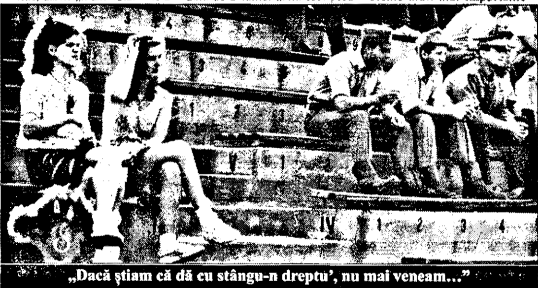
„Dacă știam că dă cu stângu-n dreptu’, nu mai veneam...”