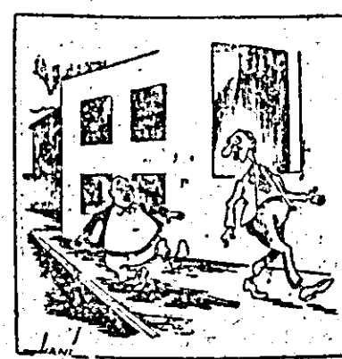
Fil mai atent cînd mergi pe trotuar. Uneori e mai primejdios decît pe mijlocul străzii.

În oraşul nostru există unele străzi cu trotuare stricte care stau de mult timp nereparate. Aşa se prezintă situaţia pe străzile Cosbuc, Aviator Sava şi altele.