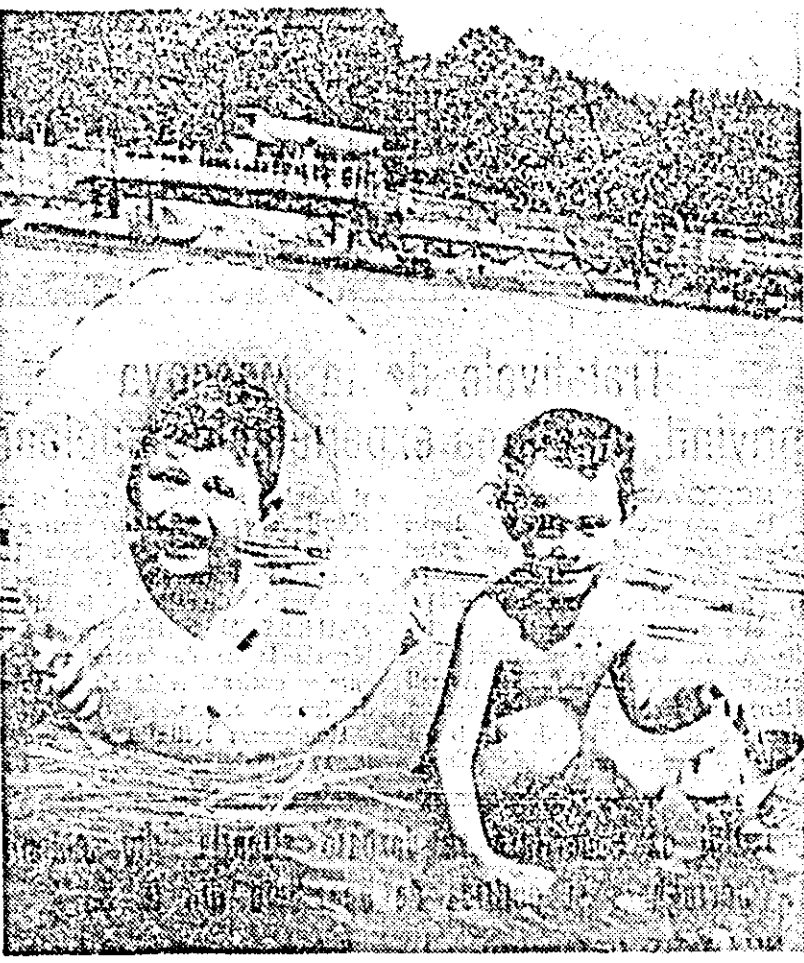
La ștrand