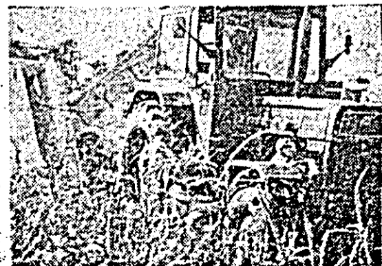
Și la ferma a V-a de la Horla a I.A.S. Uivinș recoltează porumbul este în plină actualitate.