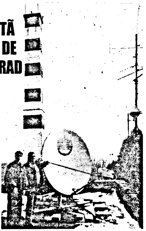
S. AMBRUȘ

De acest credit va beneficia și Serviciul Regional de Prognoză Meteorologică din Arad, care va fi dotat cu aparatură ultramodernă. Ioan Poiană, directorul tehnic al INMH, prezent, ieri, la Arad, a declarat: „Stația meteo din Arad va primi în cursul acestui an un sistem de radare digitale de ultimă generație și echipamente sofisticate de colectare a datelor. La fel se va întâmpla și la centrul Zonal din Timișoara, de care aparține Aradul, care va deveni unul dintre cele mai performante din Europa. Programul de amenajări se va încheia la mijlocul anului viitor.”