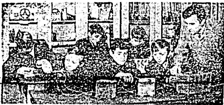
În laboratorul de fizică al școlii, elevii din Covășna pătrund în tainele tehnicii.

Cu ajutorul aparatului termo-electric „ITE-2A” realizat în U.R.S.S. se poate stabili marca otelului din care este confecțio-nată o piesă, fără să se folosească etalonul obișnuit. Pentru aceasta este suficient ca piesa respectivă să fie doar atînsă cu senzorul în-călzit al aparatului. Reacția ter-moelectrică care apare în urma unei astfel de atingeri depinde de structura metalului atîns. Aparat-ul, care cîntărește numai 3,5 kg, este foarte comod și util în sec-țiile și întreprinderile cu produc-ție de mare serie.