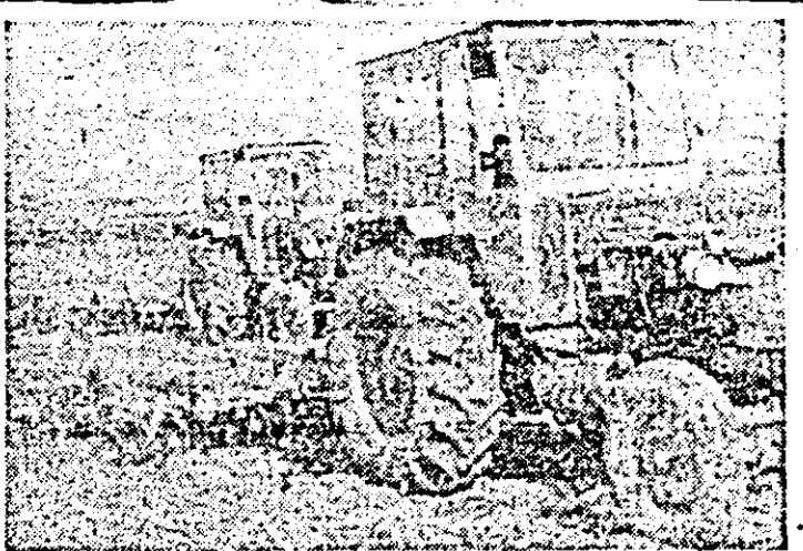
Pregătirea terenului pentru semănat în C.U.A.S.C. Arad.

E bine că la Simbăteni se lucrează și noaptea, dar și mai bine ar fi dacă ziua nu s-ar risipi timp prețios, cum s-a întimplat ieri dimineața cînd, 4 discuri și 2 semănători au ieșit la lucru abia la ora 10.