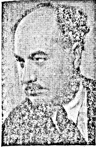
D. prof. NICHIFOR CRAINIC ministru al propagandei naționale