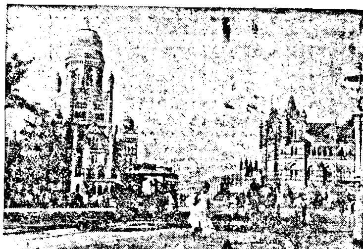
Orașul în care, după informații engleză, se țin lanț ciocnirile între populația indigenă și trupele și poliția engleză