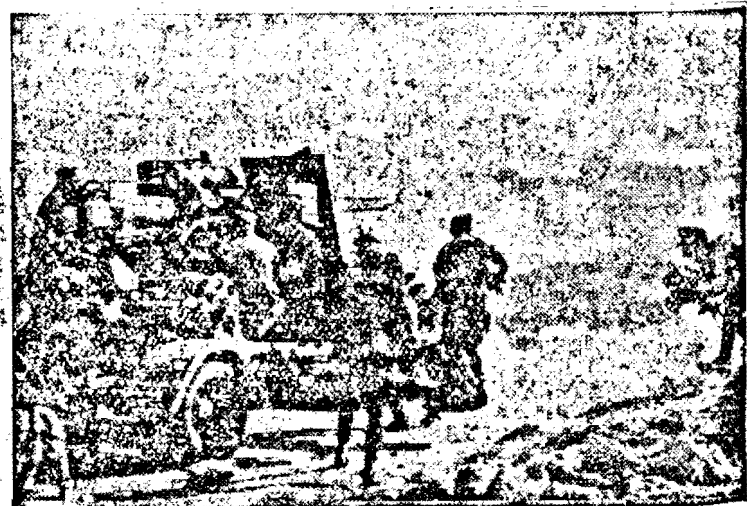
Piesă germană de artilerie grea în Africa de Nord