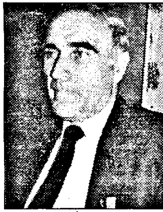
D-L DEPUTAT EMIL ROMAN (PUNR)