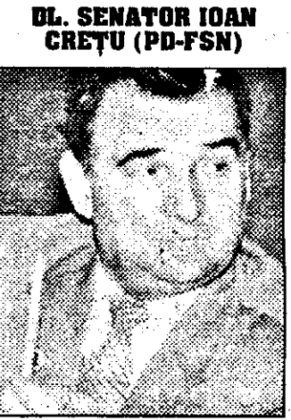
DL. SENATOR IOAN CREȚU (PD-FSN)