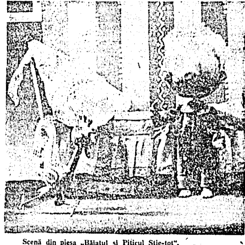
Scenă din piesa „Băiatul și Piicul Știe-tot”.