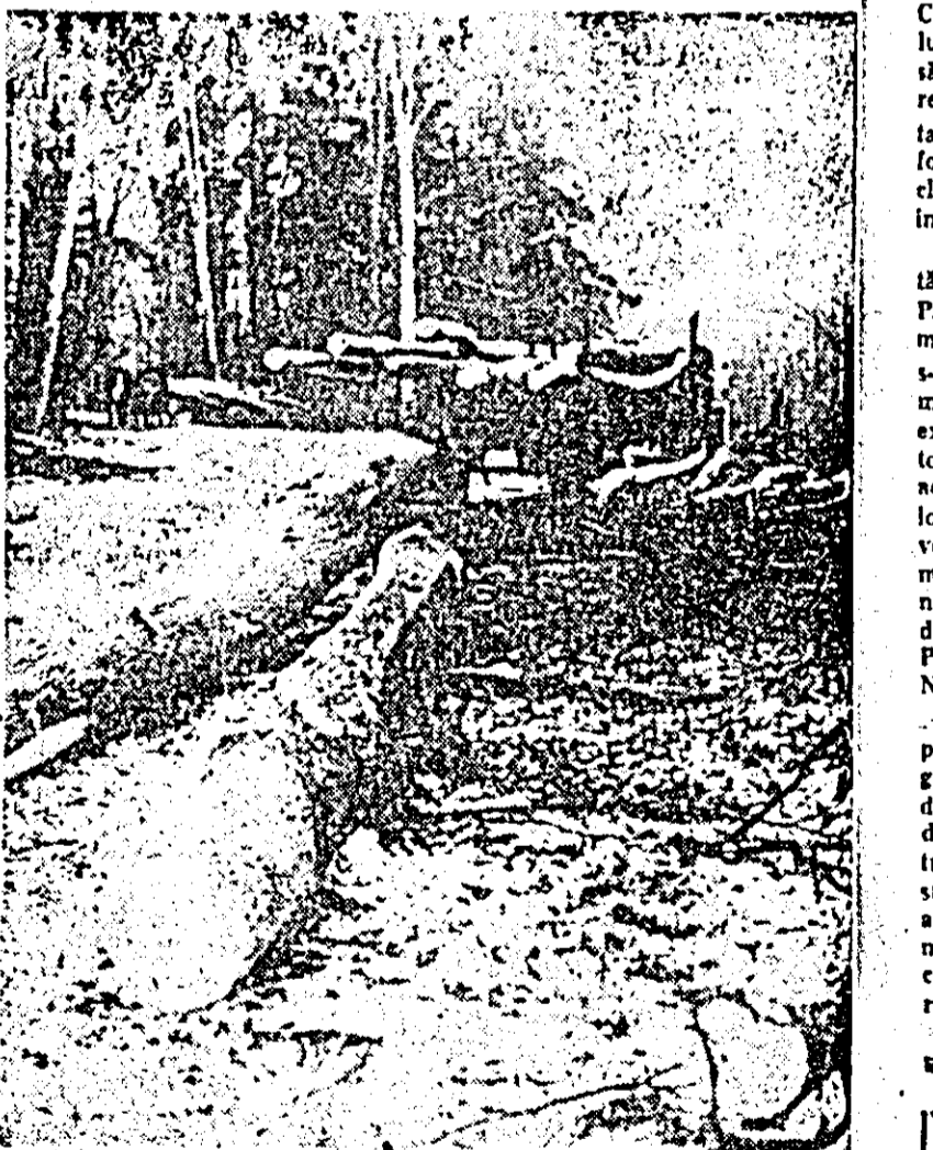
Aspect din timpul activității în pădurile vodatelor Olstyn și Kozallin, care dau anual cea 1.500.000 mc. de material lemnos, în special brad.

PRAGA 25 (Agerpres). — La 25 ianuarie, la Praga au avut loc funeraliile studentului Jan Palach. Au depus coroane și a participat la funeralii reprezentanți ai guvernului și ai organizațiilor obștești, cadre didactice universitare și studenți, delegații din partea unor întreprinderi și instituții. Mii de locuitori ai orașului Praga și din alte localități au condus pe ultimul său drum pe Jan Palach.