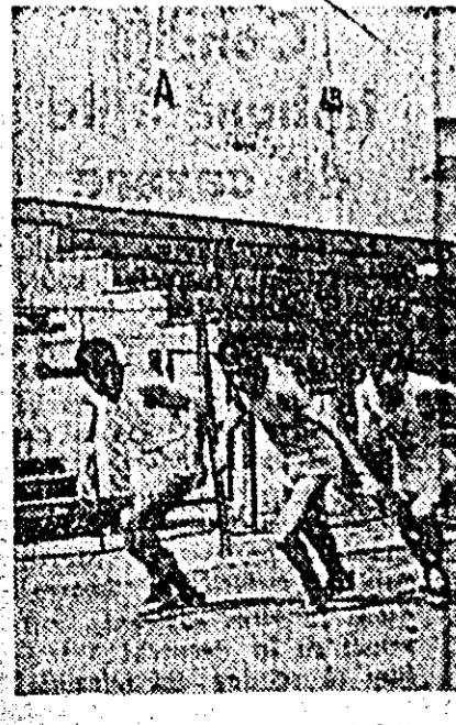
Sîmbătă și duminică s-a desfășurat în orașul Arad un concurs de selecție la care au participat atleți și atlete de la Școala sportivă de elevi Oradea și Școala sportivă de elevi Arad.

Nu a fost un meci greu de câștigat deoarece sportivii din Oradea s-au comportat destul de slab, sub nivelul diviziei B. Arădenii au câștigat astfel trei seturi la 8, 8 și 7. Au pierdut setul II la 8.